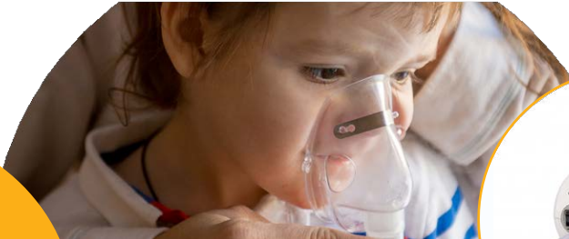
Illustrative image: OMRON ComPAIR NE-C28P